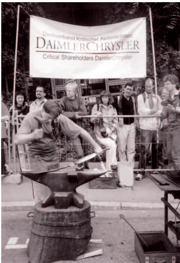
»Schwerter zu Pflugscharen« – symbolische Umschmiedeaaktion während des Kirschentags in Stuttgart.

Die Kampagne gegen Rüstungsexport bei Ohne Rüstung Leben wird vom Evangelischen Entwicklungsdienst (EED) finanziell gefördert.